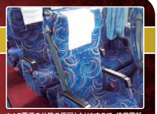
※AC電源の故障の原因となりますので、携帯電話・タブレット以外のご利用はご遠慮ください。