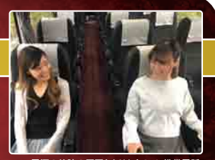
※AC電源の故障の原因となりますので、携帯電話・タブレット以外のご利用はご遠慮ください。